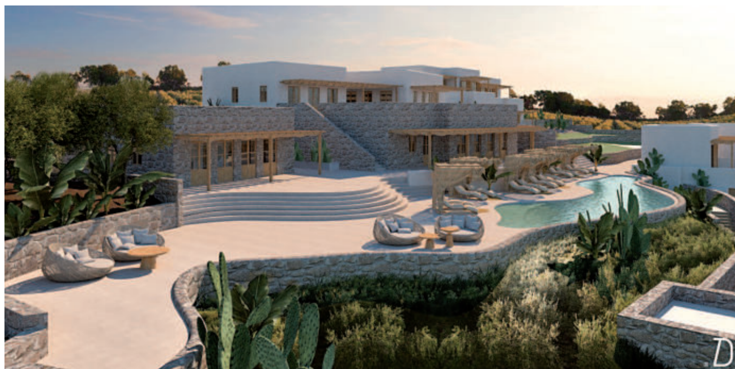
ΞΕΝΟΔΟΧΕΙΟ ΠΕΝΤΕ ΑΣΤΕΡΩΝ SIR MAXIMUS, ΜΥΚΟΝΟΣ, ΠΑΡΑΓΚΑ, 2020. ΤΡΙΣΔΙΑΣΤΑΤΗ ΑΠΕΙΚΟΝΙΣΗ: DEZONE.