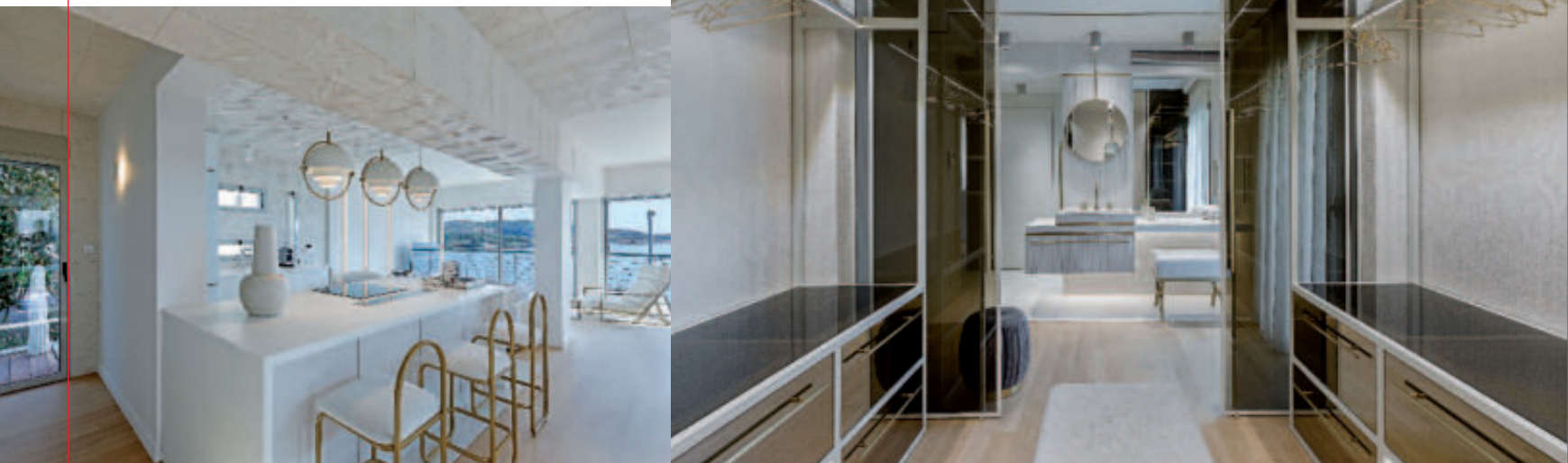
SMART SEASIDE LUXURY APARTMENT ΣΤΗ ΒΟΥΛΙΑΓΜΕΝΗ, 2019, © ΠΑΝΑΓΙΩΤΗΣ ΒΟΥΜΒΑΚΗΣ.